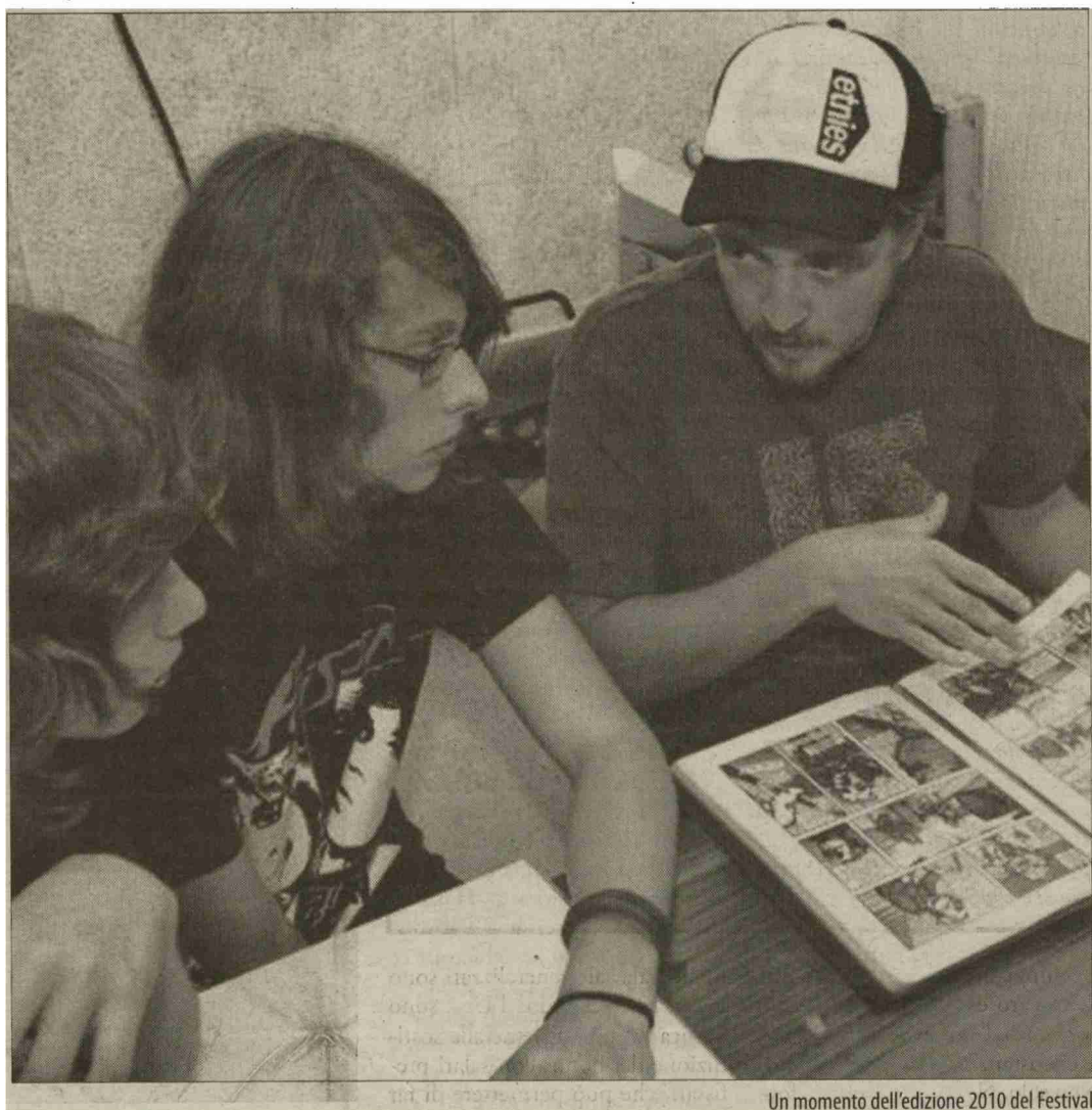
Un momento dell'edizione 2010 del Festival

L'importanza della formazione continua per gli adulti in una 24 ore di Festival a livello nazionale